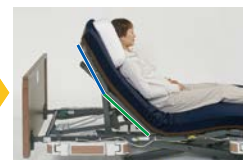
ハイバック20°+ローバック45°