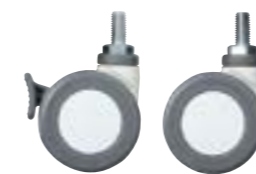
ストッパー付×2個 ストッパー無し×4個