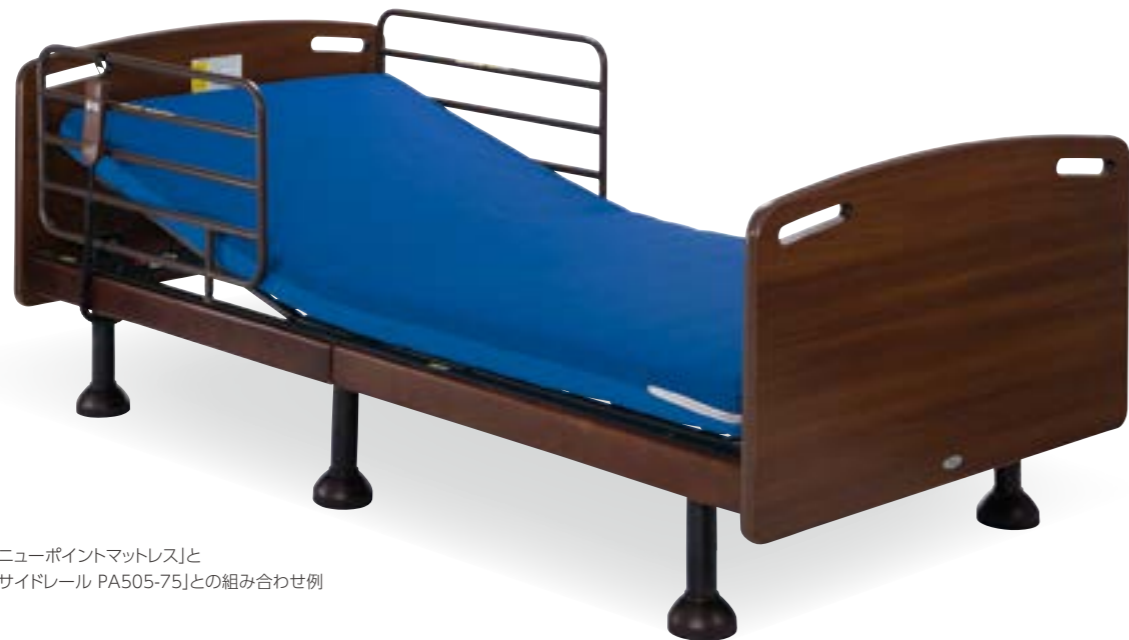
「ニューポイントマットレス」と 「サイドレール PA505-75」との組み合わせ例